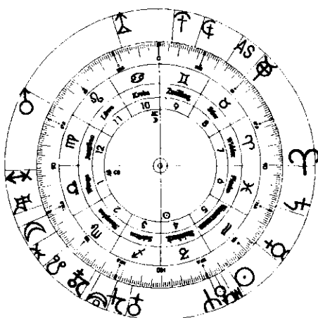
Augenblickshoroskop: Anzeigenprotokoll unterschrieben ☾ Achse ♍-Horoskop